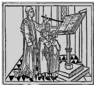
Lectio transit in mores